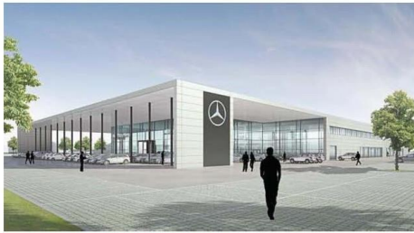
So soll das „Autohaus der Zukunft“ aussehen, dass die Firma Beresa am neuen Standort Loddeneide errichtet. Verkauft werden hier Mercedes- und Smart-Fahrzeuge.

Das Gewerbegebiet Loddeneide befindet sich im Südosten von Münster; einstiges Militärgelände, langjährig als Militärflughafen/Fliegerhorst genutzt. Bis Mitte 1990er Jahre militärisch genutzt. Anschließend erfolgte die Konvertierung zum Gewerbegebiet.