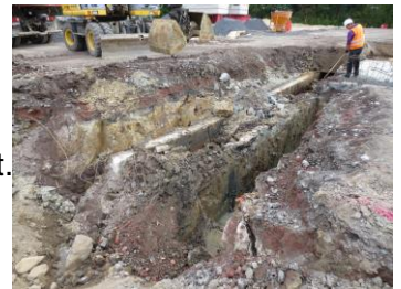
Münster - Nach langer Vorplanung geht es jetzt los mit dem Neubau des Beresa-Autohauses auf der Loddeneide. Am Freitag erfolgte der erste Spatenstich.