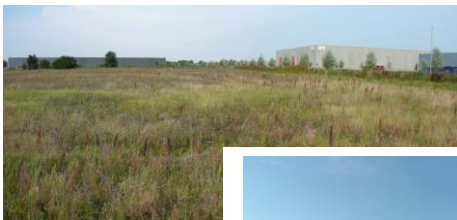
Greve / Dänemark