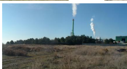
Rognac / Frankreich