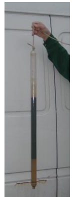
Ölphase auf dem Grundwasser in Rognac / Frankreich